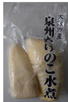
大阪府産泉州 たけのこの水煮

たけのこ、ふきは下記の水煮の状態で納品され調理されています。調理員さんいつもありがとうございます。