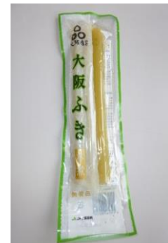
大阪産 ふきの水煮