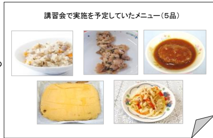
講習会で実施を予定していたメニュー(5品)