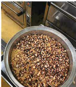
た あ 炊き上がり

写真 しやしん は、11月 がつ 16日 にち に能勢町 のせちやう でいづみだこを使用 し した「たこ飯 たこめし 」です。大きい炊飯 すいはん 釜 かま で炊き込み た 大阪 おおさか 産 さん 泉 いづみ だこを沢山 たくさん 使用 し した様子 ようす が伺 うかが えます。とっても美味 おいしい しかったそうです。