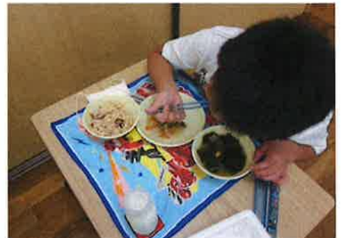
おい しく いただ 美味しく頂きました